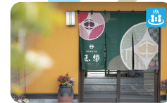
11 那古井館別邸 玉響 家族湯