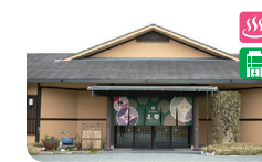
10 那古井館別邸 玉響