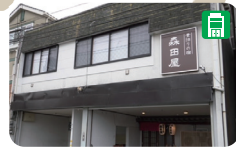
13 素泊まりの宿 森田屋