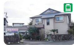
14 ビジネス旅館 末広