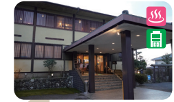
4 里山リゾート さつき別荘