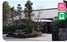
1 山もみじの宿 八芳園