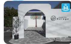
12 Private Spa Kurage